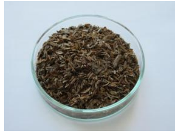
微生物製剤「バイオコート」