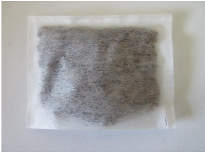
パック : 5～20g入り